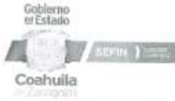
TABULADOR DEL PERSONAL DE PROGRAMAS (EVENTUAL) TÉCNICO OPERATIVO VIGENCIA A PARTIR DEL 01 DE FEBRERO DE 2023